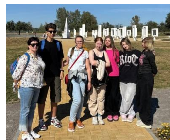
122 группа в Красном Берегу. Посетили усадьбу Готовского и мемориальный комплекс детям-жертвам ВОВ