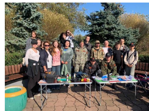
323 и 423 группы на учениях поисково-спасательного отряда «Феникс»