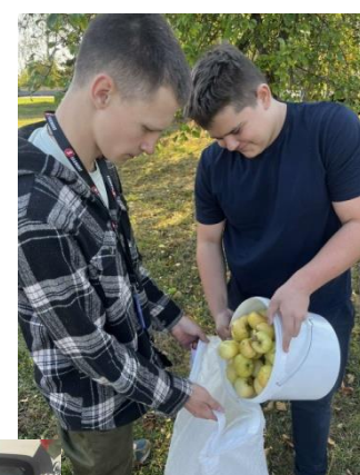
Проект «Сад надежды». Уборка яблок в саду-памятнике в агрогородке Ленина