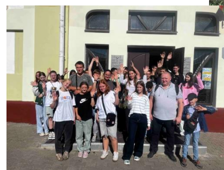
424 и 223 группы в краеведческом музее