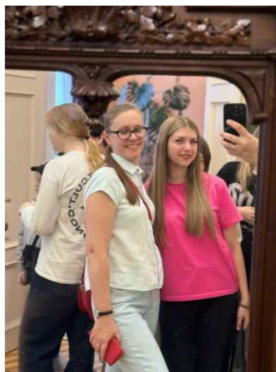
Съемки профориентационного проекта «ПРОФ-БУМ – 2024»