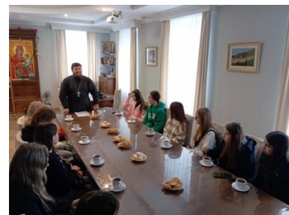
224 группа в центре «Покрова»