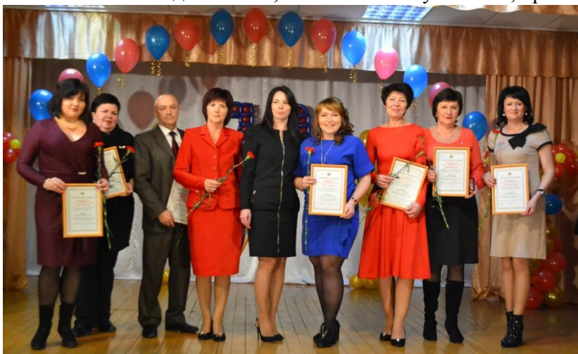
Главная ценность колледжа — люди, которые в нём работают

Увеличивающийся план набора требовал расширения учебных площадей и потому, в 1960 году общежитие было переоборудовано под учебные классы. Приходилось заниматься в две смены, в стесненных условиях, арендовать спортивный зал и помещение для проведения культурно-массовых и кружковых мероприятий.