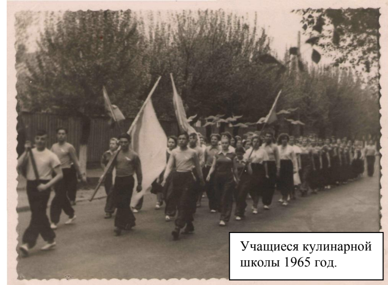
Учащиеся кулинарной школы 1965 год.