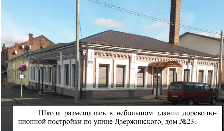
Школа размещалась в небольшом здании дореволюционной постройки по улице Дзержинского, дом №23.

1946 год. Прошел всего лишь один год после окончания самой страшной по своей разрушительности, человеческим жертвам второй мировой войны и немногим более двух лет после освобождения Бобруйска от немецко-фашистской оккупации. Город еще лежит в руинах, жители получают хлеб по карточкам, но уже открывается учебное заведение по подготовке кадров для торговли и общественного питания. Первый набор насчитывал 150 человек — 4 учебные группы со сроком обучения полтора года. В школе готовили кулинаров, бухгалтеров, продавцов промышленных и продовольственных товаров. На обучение принимали молодежь в возрасте 15-19 лет с образованием не ниже 7 классов.