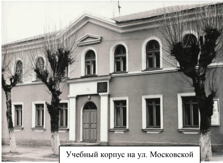
Учебный корпус на ул. Московской

В 1948 году были набраны на обучение учащиеся, имеющие 7-10 классов образования. В связи с потребностью народного хозяйства школа торгово-кулинарного ученичества стала готовить счетоводов, кулинаров, официантов, калькуляторщиков, заведующих буфетами. Мастерами производственного обучения были лучшие повара треста столовых и ресторанов. Но материальная база школы оставалась слабой. В школе не было помещения для проведения культурно-массовых мероприятий, своей столовой, буфета. Только в 1956 году на улице Московской было открыто общежитие на 60-70 учащихся. Неизменным оставалось одно: высокий уровень подготовки профессиональных квалифицированных работников для сферы торговли и общественного питания.